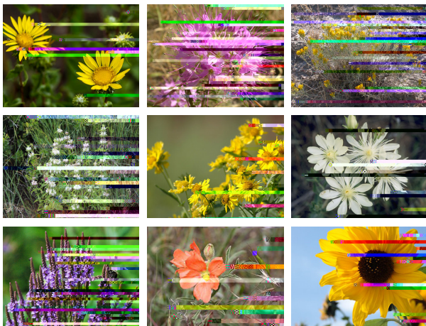
1. Falsa margarita

Fotografías de abejas del departamento de Agricultura de Oregon